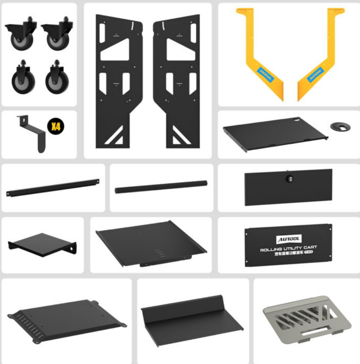
Wagenframe T23 | 360° roterende standaard | 4-inch stille wielen | Bevestigingsriem voor apparatuur | Zijkanten voor kabels | Set montageschroeven | Montagehandleiding | Lade met slot