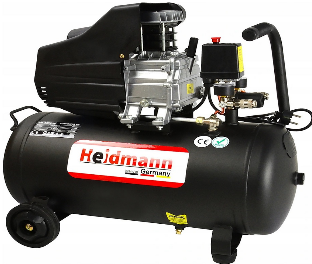
OLIECOMPRESSOR COMPRESSOR 50L 8bar HEIDMANN H00721

Een van de krachtigste 50 liter compressoren op de markt!